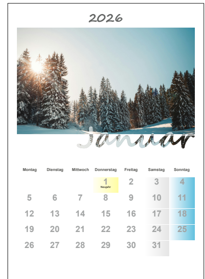
Abb. 1: Kalender 2026